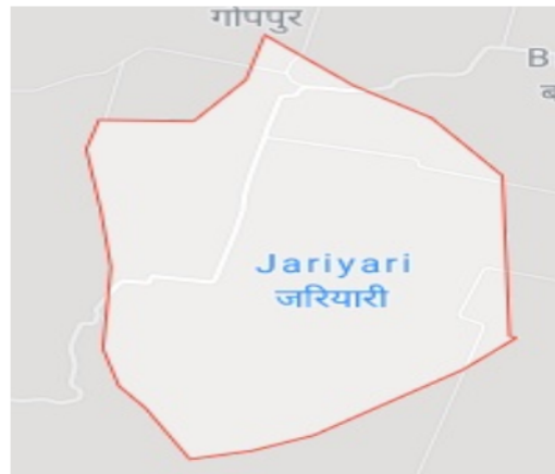
Google Map View