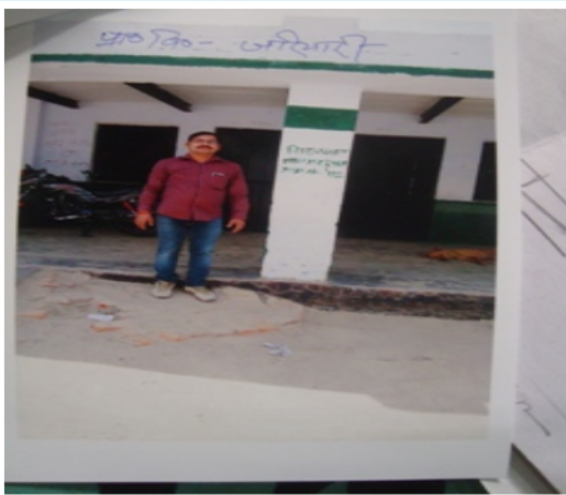
Polling Station Building Front View